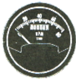
サイズ 2" #81-1224 ..... ¥35,400 #81-5112 ..... ¥37,680 (4サイクル(912)用)