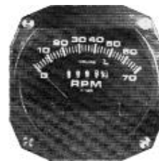
サイズ 3-1/8" #81-1226 ..... ¥42,960

※0~8000RPM及び0~9999時間 までの回転計とアワーメーターが セットになっている計器です。 2サイクル用(ポイント及び D/IGNITION)と4サイクル (Rotax 912)用がございますので 用途に合わせてお選び下さい。