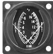
CHT/EGT 2-1/4" #81-1322 ..... ¥20,760