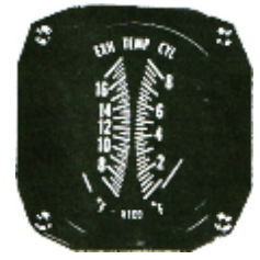
CHT/EGT 3-1/8" #81-1324 ..... ¥28,560

※CHTとEGTが1つになっている計器です。センサー関係は含まれておりませんので必要なタイプを別途お求め下さい。