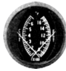
CHT/EGT-3" #81-1323 ..... ¥27,240