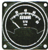
サイズ 2-1/4" #81-1225 ..... ¥37,200 #81-5113 ..... ¥39,450 (4サイクル(912)用)