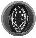
CHT/EGT-2" #81-1321 ..... ¥17,980