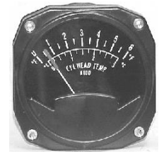
CHT 3-1/8" (0~700°F) #81-1308 ..... ¥14,800