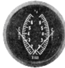
CHT/CHT 3" (0~700°F) #81-1318 ..... ¥16,900