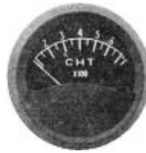
CHT 3" (0~700°F) #81-1307 ..... ¥14,600