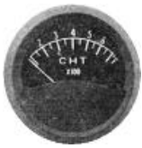
CHT 2" (0~700°F) #81-1305 ..... ¥9,300