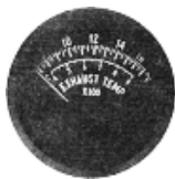
EGT 2" (700~1700°F 又は 400~900°) #81-1309 ..... ¥10,600