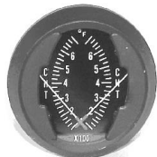
CHT/CHT 2" (0~700°F) #81-1316 ..... ¥13,900