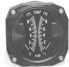
CHT/CHT 3-1/8" (0~700°F) #81-1816 ..... ¥18,600

(注)メーターにはセンサーは含まれておりません。プラグサイズを確認して下記よりお選び下さい。