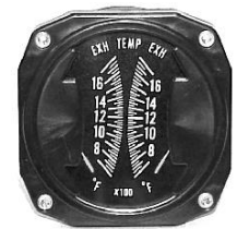
EGT/EGT 3-1/8" (600~1700°F) #81-1913 ..... ¥18,900

(注)メーターにはセンサーは含まれておりませんので、希望のタイプのセンサーを下記よりお選び下さい。