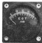
EGT 2-1/4" (700~1700°F 又は 400~900°) #81-1310 ..... ¥11,900