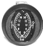
EGT/EGT 2" (600~1700°F) #81-1319 ..... ¥14,800