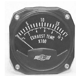
EGT 3-1/8" (700~1700°F 又は 400~900°) #81-1312 ..... ¥15,900