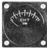
CHT 2-1/4" (0~700°F) #81-1306 ..... ¥10,600