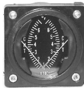
CHT/CHT 2-1/4" (0~700°F) #81-1317 ..... ¥15,800