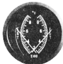
EGT/EGT 3" (600~1700°F) #81-1916 ..... ¥18,200