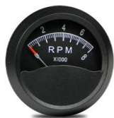
#81-01615 ..... ¥16,500 0~8000RPM - 2"