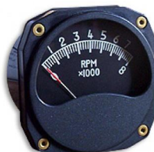
#81-05836 ..... ¥23,800 0~8000RPM - 3-1/8"