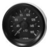
#12-RTA12 ..... ¥22,300 0~8000RPM - 2"

※この回転計は、RANS社の純正計器として発売されています。裏側の切替スイッチにより、2サイクルエンジン(ポイント及びD/IGNITION)及び4サイクルエンジン(ROTAX 912)等、2気筒・3気筒・4気筒HIRTH・ROTAX 問わず全てのエンジンに使用出来ます。