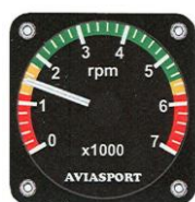
ROTAX912-914 用 #02-966-405 ..... ¥32,600 0~7000RPM - 2-1/4"