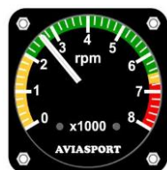
ROTAX用 #02-966-405 ..... ¥28,900 0~8000RPM - 2-1/4"