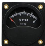
#81-00816 ..... ¥17,900 0~8000RPM - 2-1/4"