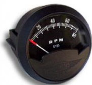
#81-03924 ..... ¥25,600 0~8000RPM - 2" (WESTACH製)