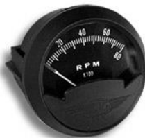
#81-1303 ..... ¥19,800 0~8000RPM - 3"