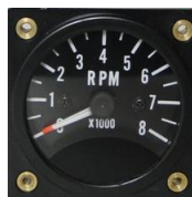
フルスケールゲージ(12V要) #81-WS2ATH8A1 ..... ¥35,600 0~8000RPM - 2-1/4"