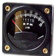
#81-03980 ..... ¥26,300 0~8000RPM - 2-1/4" (WESTACH製)