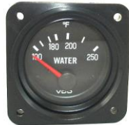
サイズ 2-1/4"(57.15) DC/12V #81-01649 ..... ¥10,900