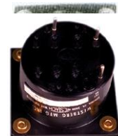
●ローパワーアダプター #84-002 ..... ¥6,900 (アワーメーター用)

※水温計にはセンサーは含まれておりませんので別途お求め下さい。センサーリード線の長さは約1.8mです。バッテリー(12V)を必要としますがMAGアダプターを使用する事によって直接エンジンのライティングコイルから稼働させる事が出来ます。