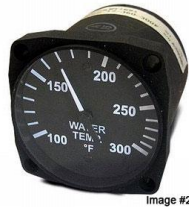
サイズ 2-1/4"(57.15) #81-91278 ..... ¥36,700 (ULS) #81-91279 ..... ¥36,700 (iS)