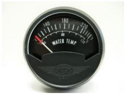
サイズ 2"(50.8) DC/12V #81-04132 ..... ¥12,600