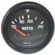
サイズ 2"(50.8) DC/12V #81-01646 ..... ¥9,700