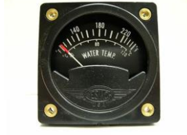
サイズ 2-1/4"(57.15) DC/12V #81-2A9-1 ..... ¥12,900