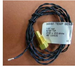
#81-01288 ..... ¥6,900 (※WESTACH #81-04132/#81-2A9-1用)