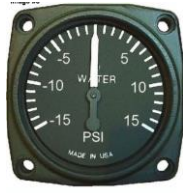
サイズ 2-1/4"(-15~15PSI) #81-02249 ..... ¥35,300

※これらの計器は電源を必要としないメカニカルタイプの水圧計です。 専用アダプターは含まれておりますが、ホース関係は含まれておりません。 ホースは必要な長さをお求め下さい。(1Ft/30cm単位)