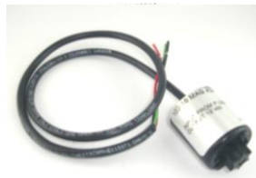
●MAG アダプター #84-003 ..... ¥4,870 (水温計用)