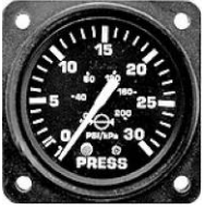
サイズ 2-1/4"(0~30PSI) #81-OPO32.1 ..... ¥14,800