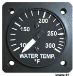
サイズ 1-1/4"(31.7) #81-91276 ..... ¥36,700 (ULS) #81-91277 ..... ¥36,700 (iS)