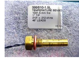
10×1.5mm thread, 1" tip #81-02641 ..... ¥7,600