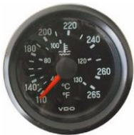
#81-15602 ..... ¥16,800 リード配72"(182cm) ※バッテリーを必要としません。 ※センサー含む